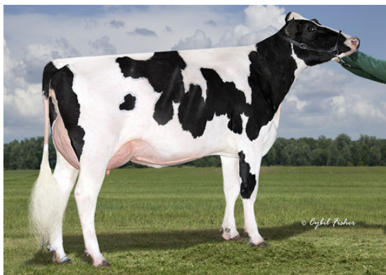
SIEMERS GRT PARINI 28262 GRANDDAM