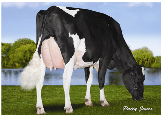
RANSOM-RAIL FACEBK PARIS FIFTH DAM